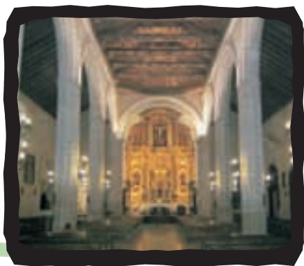
▲ PARROQUIA DE LA ASUNCIÓN

Declarada Monumento Histórico-Artístico, se ubica en la Plaza de España. Obra de los cordobeses Hernán Ruiz II y III, es de estilo renacentista, y destaca por su monumentalidad y belleza.