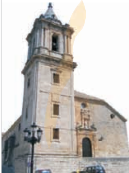
▼ PARROQUIA DE LA ASUNCIÓN

Luque posee gran número de ermitas como las de La Aurora, La Virgen del Castillo, y la de San Bartolomé -que alberga la imagen del patrón-. Destacar también a su vez la iglesia del antiguo Convento de los Agustinos Descalzos, templo barroco del siglo XVIII. En la arquitectura civil hay que señalar La Torre del Reloj.