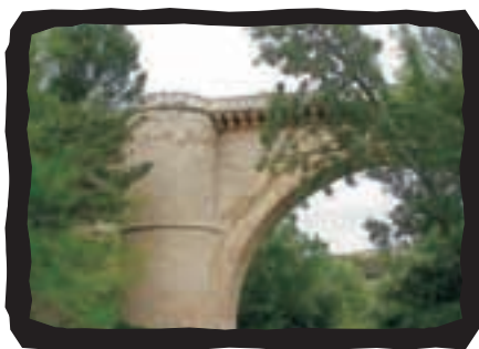
▲ PUENTE RENACENTISTA

circundantes, siendo ésta la morada de la patrona.