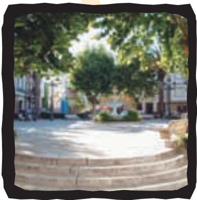
▼ PLAZA DE ANDALUCÍA

Doña Mencía es un pueblo en el que las huellas de las culturas más antiguas están presentes en su museo, yacimientos arqueológicos y calles. En el antiguo barrio medieval encontraremos enclavado el Castillo que reconstruido por Alvar Pérez de Castro, capitán de Fernando III, le otorgó el nombre de su esposa, D a Mencía López de Haro -. En las mazmorras de este castillo estuvo prisionero -según cuenta la leyenda- el Gran Capitán, cuando tan sólo contaba con dieciséis años. Pero la localidad sin duda alguna es tierra de afamados vinos, presentados bajo la Denominación de Origen Montilla-Moriles, y buenos aceites bajo la Denominación de Origen Baena. De los caldos mencianos dijo Azorín que "todos son insuperables, siendo admirables por su aroma, limpidez y sabor".