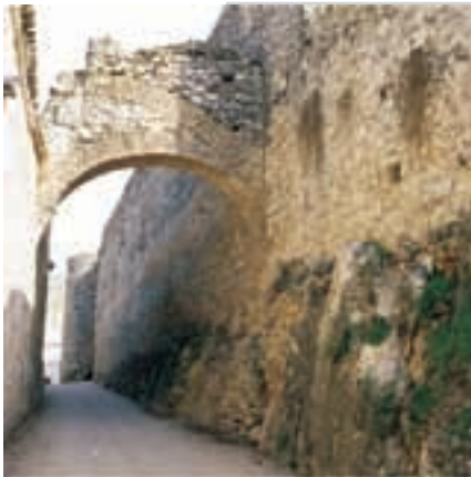
▲ CALLE DE LA VIRGEN

Ubicado en la Casa de la Cultura, en él se encuentran depositados materiales arqueológicos procedentes de los más de 300 yacimientos existentes en la zona.