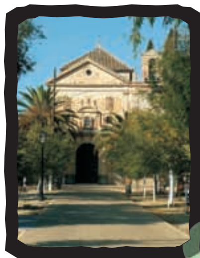
▲ ERMITA DE NUESTRO PADRE SEÑOR DE LAS PENAS

El origen de su nombre se debe a las encinas que antiguamente poblaban sus parajes.