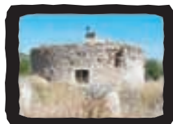
▲ MOLINO DE FUENTE TOJAR

Antigua cruzada romana ofrece bellas vistas del término.